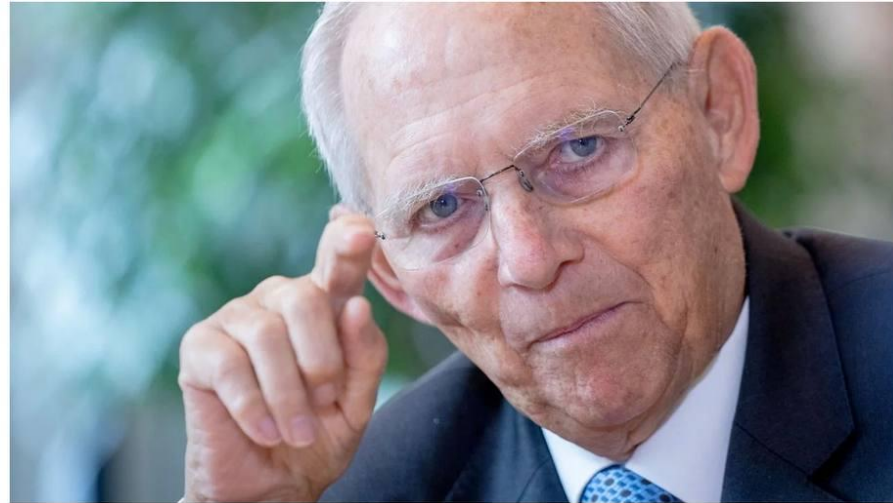
Bundestagspräsident Wolfgang Schäuble.

Die sinkende Impfbereitschaft in Deutschland macht Wolfgang Schäuble "maßlos traurig". Für eine unterschiedliche Behandlung von Geimpften und Ungeimpften sieht er keine Probleme.