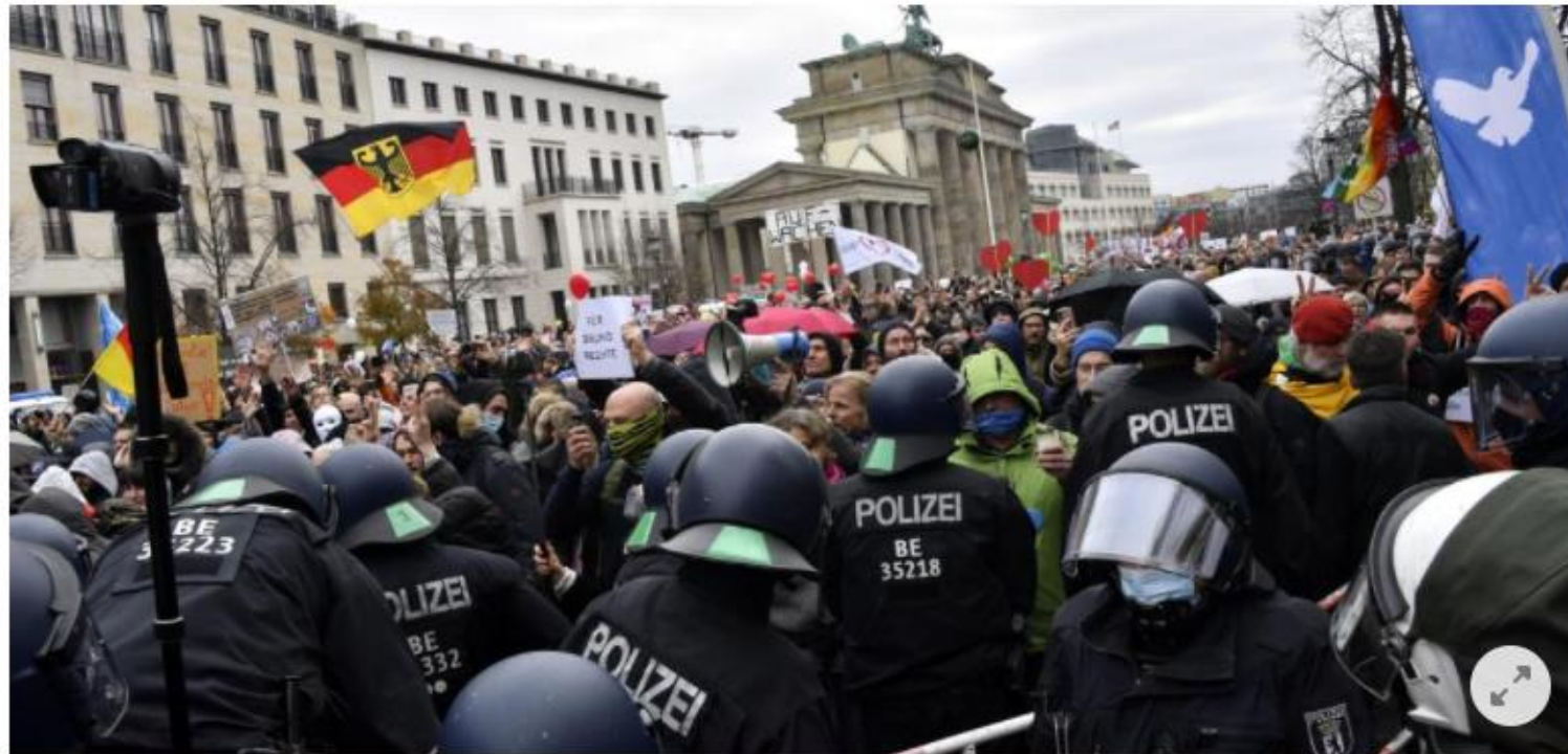
Corona-Protest im Regierungsviertel im November 2020