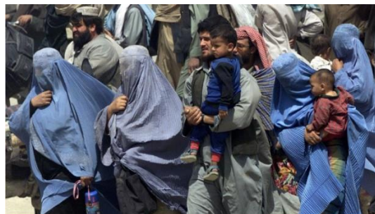
Women under the previous Taliban regime were forced to wear burkas and could not go out without a male relative