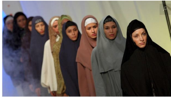
Fotomodellen die wél voldoen aan de wensen van de Iraanse overheid.