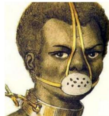
Mondkapjes gedragen vroeger door slaven