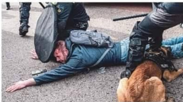
Een man worstelt met een politiehond en krijgt fikse klappen, ook op zijn hoofd. De agenten 'mikten' op zijn arm en raakten per ongeluk zijn hoofd, denkt de politie.

was natuurlijk niet de bedoeling. Zij werd optijd geduwd om een aanhouding veilig te stellen. Zij raakte naar mijn weten niet gewond en gelukkig maar.' Over een ander filmpje, waarbij een demonstrant beide oren van een politiehond vasthoudt om de tanden van het dier op een afstandje te houden, zegt de hoofdcommissaris: 'Het ziet er naar uit dat de agenten op zijn armen mikkten met de wapenstok, maar per ongeluk ook zijn hoofd raakte.' Alle geweldsincidenten worden volgens hem geëvalueerd door de Commissie Geweldsaanwending en eventueel voorgelegd aan het Openbaar Ministerie.