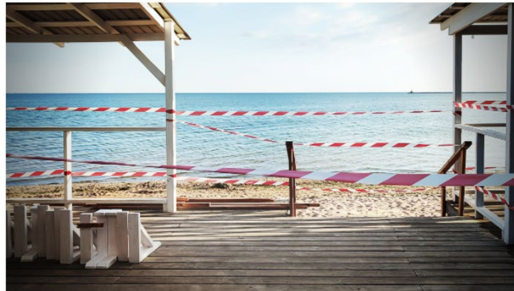
Afbeelding: freepik / user20678629