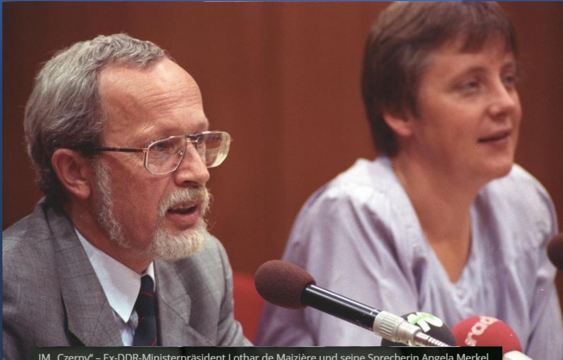
IM „Czerny“ – Ex-DDR-Ministerpräsident Lothar de Maizière und seine Sprecherin Angela Merkel