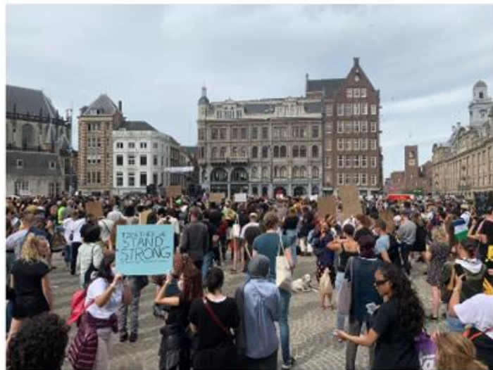
Demonstranten op de Dam aan het begin van de avond.