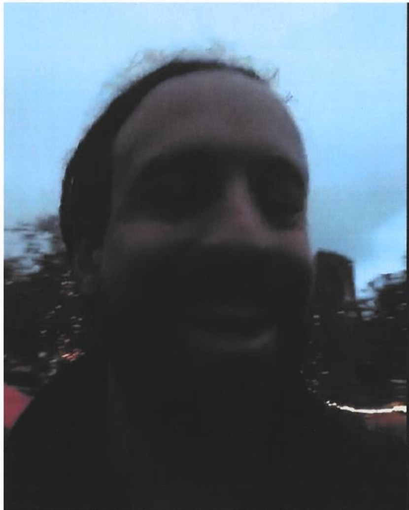
De verdachte Willem Engel, op het plein te Den Haag op 8 oktober 2020