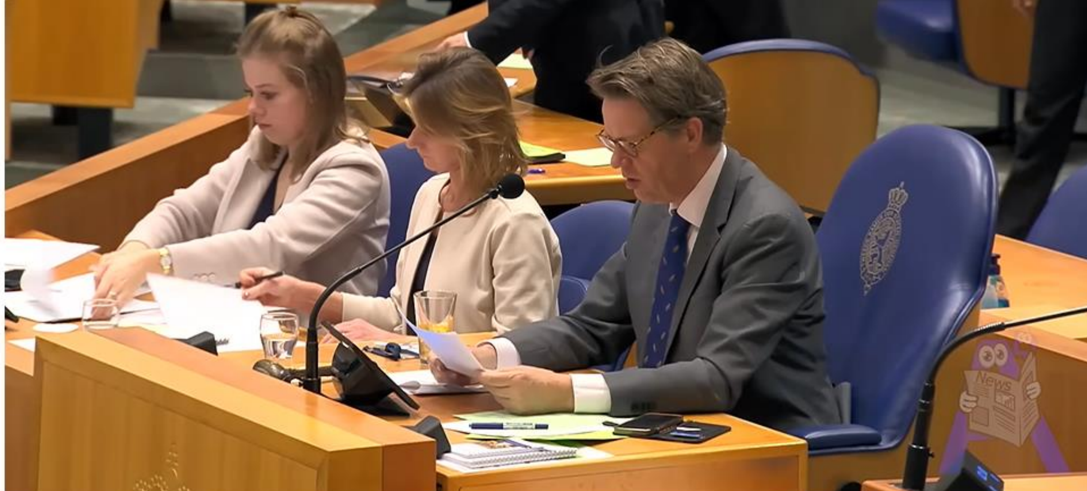
Onvrede in de Kamer: Minister Kuipers weigert vrijgeven OMT-tapes - Tweede Kamer (Artikel 68)

https://www.youtube.com/watch?v=VNArQER9ZyQ