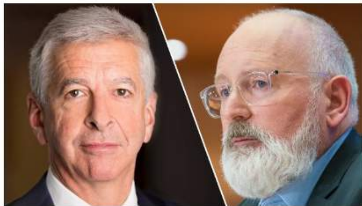
Ronald Plasterk en Frans Timmermans