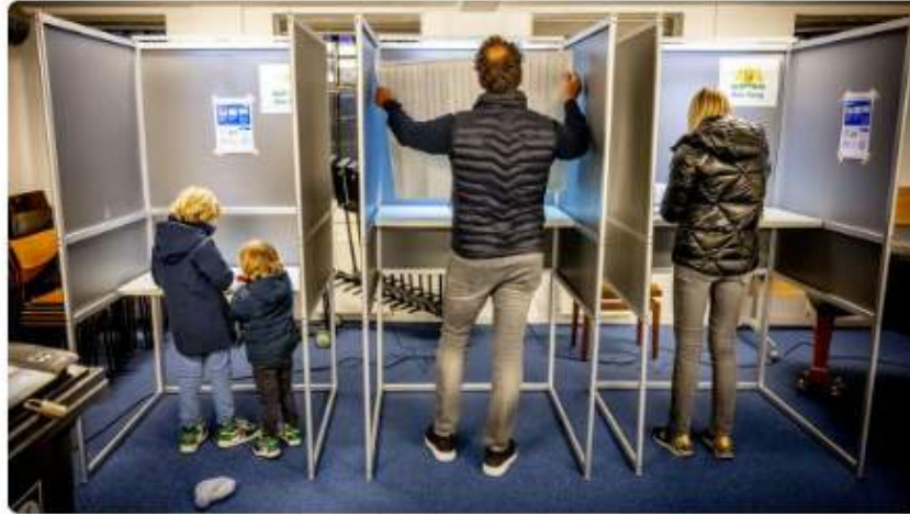
Stemmen op een van de 283 stembureaus in Den Haag