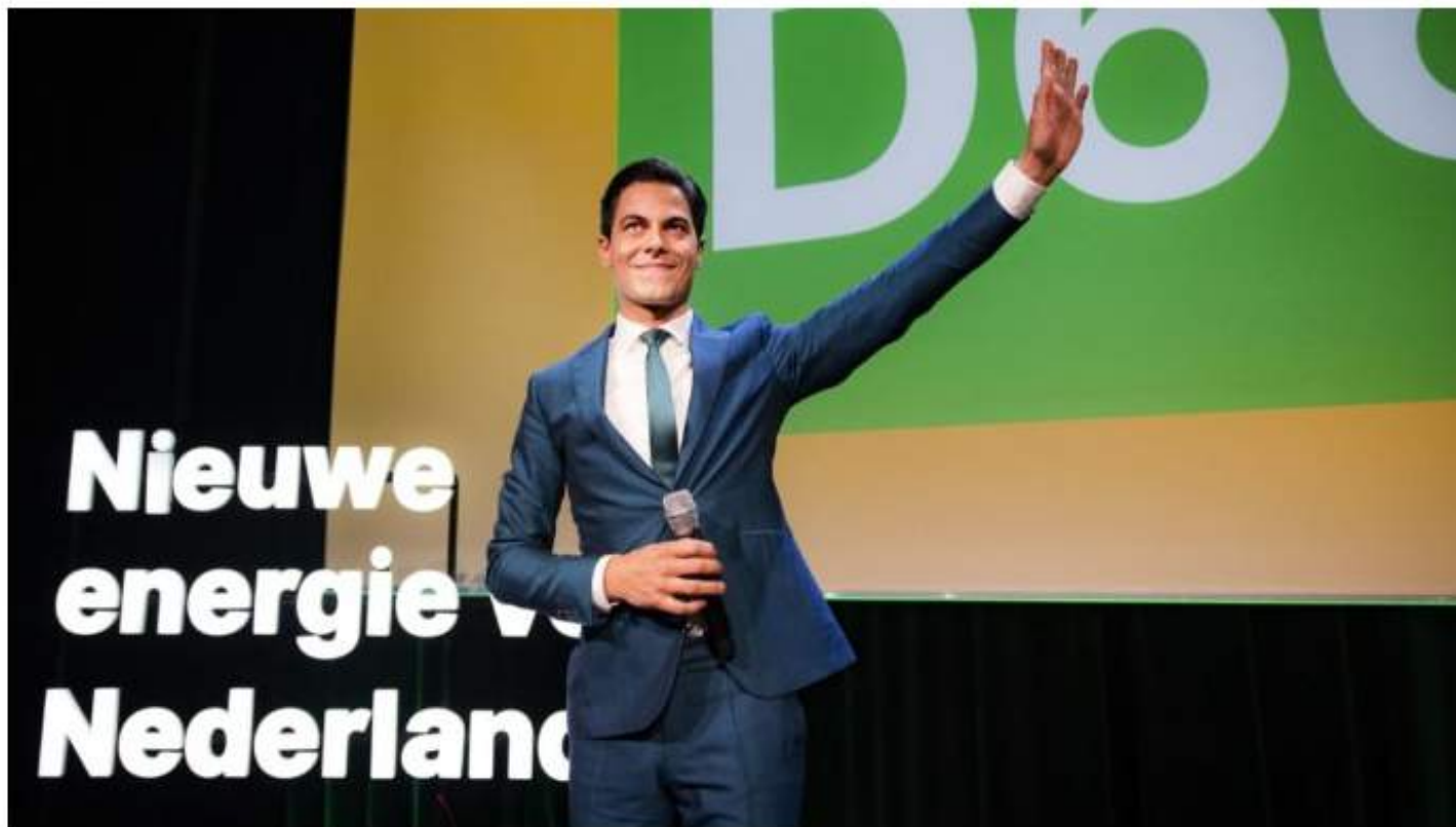
D66-leider Rob Jetten.

D66 komt waarschijnlijk niet met negen, maar met tien mensen in de nieuwe Tweede Kamer. De partij lijkt de 150e en laatste Kamerzetel te krijgen in de definitieve prognose van de Verkiezingsdienst van het ANP, nu de laatste uitslagen zijn doorgegeven.