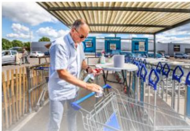
Een man reinigt bij de Gamma in Ubrecht hetsvermoedend zijn wagentje.

Maarten Keulemans 1 augustus 2020, 05:00